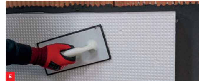
E Dämmplatten können mit HECK 2K TURBO DB sowohl auf mineralische wie auch bituminöse Untergründe geklebt werden.