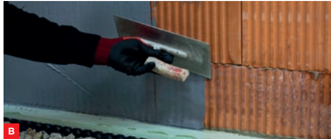
B Bei Bedarf wird der Untergrund vorab mit HECK 2K TURBO DB egalisiert bzw. eine Kratzspachtelung aufgetragen.