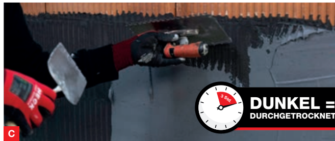
C Die Abdichtung erfolgt in zwei Lagen. Nach Auftrag der 1. Lage... DUNKEL = DURCHGETROCKNET