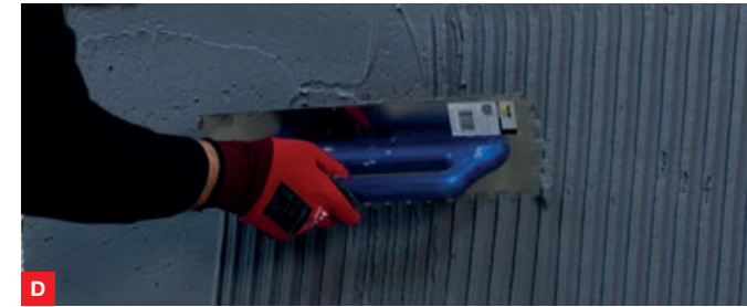
D ...kann bereits 3 Stunden später die 2. Lage aufgebracht werden.