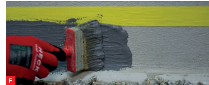
F Auch als Dichtungsschlämme auf einer fertigen Armierungsschicht ist HECK 2K TURBO DB einsetzbar.