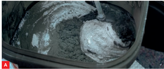
A Die Pulver- (12 kg) und Flüssigkomponente (8 kg) werden im Hobbock vermischt.

HECK 2K TURBO DB ist somit ein multifunktionales 2-in-1 Produkt. Darüber hinaus kann es auch als Egalisierungsmörtel für Vertiefungen bis 5 mm sowie zum Verkleben der Sockel-/Perimeterdämmplatten eingesetzt werden. In diesen Fällen ist das fertige Produkt (20 kg) mit handelsüblichem Quarzsand (5 kg, Körnung 0,1 – 0,35 mm) zu vermischen.